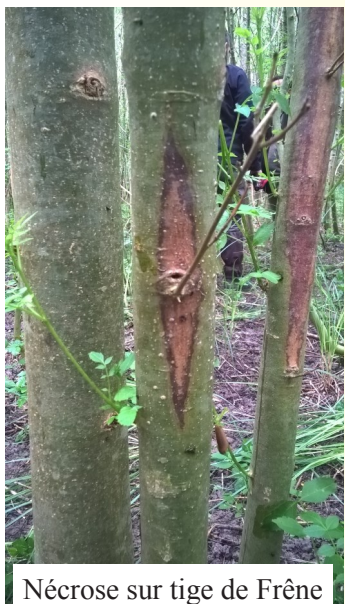
Nécrose sur tige de Frêne

Les pathogènes qui touchent nos arbres évoluent rapidement. Ainsi, cette réunion sera particulièrement consacrée aux problèmes sanitaires des essences de nos vallées. Un bilan sera établi concernant les maladies touchant le peuplier. L'Encre de l'Aulne sera également décrite. Mais c'est la Chalarose du Frêne qui sera détaillée au cours de la journée, car cette maladie, émergente dans notre région, impacte déjà fortement les frênaies.